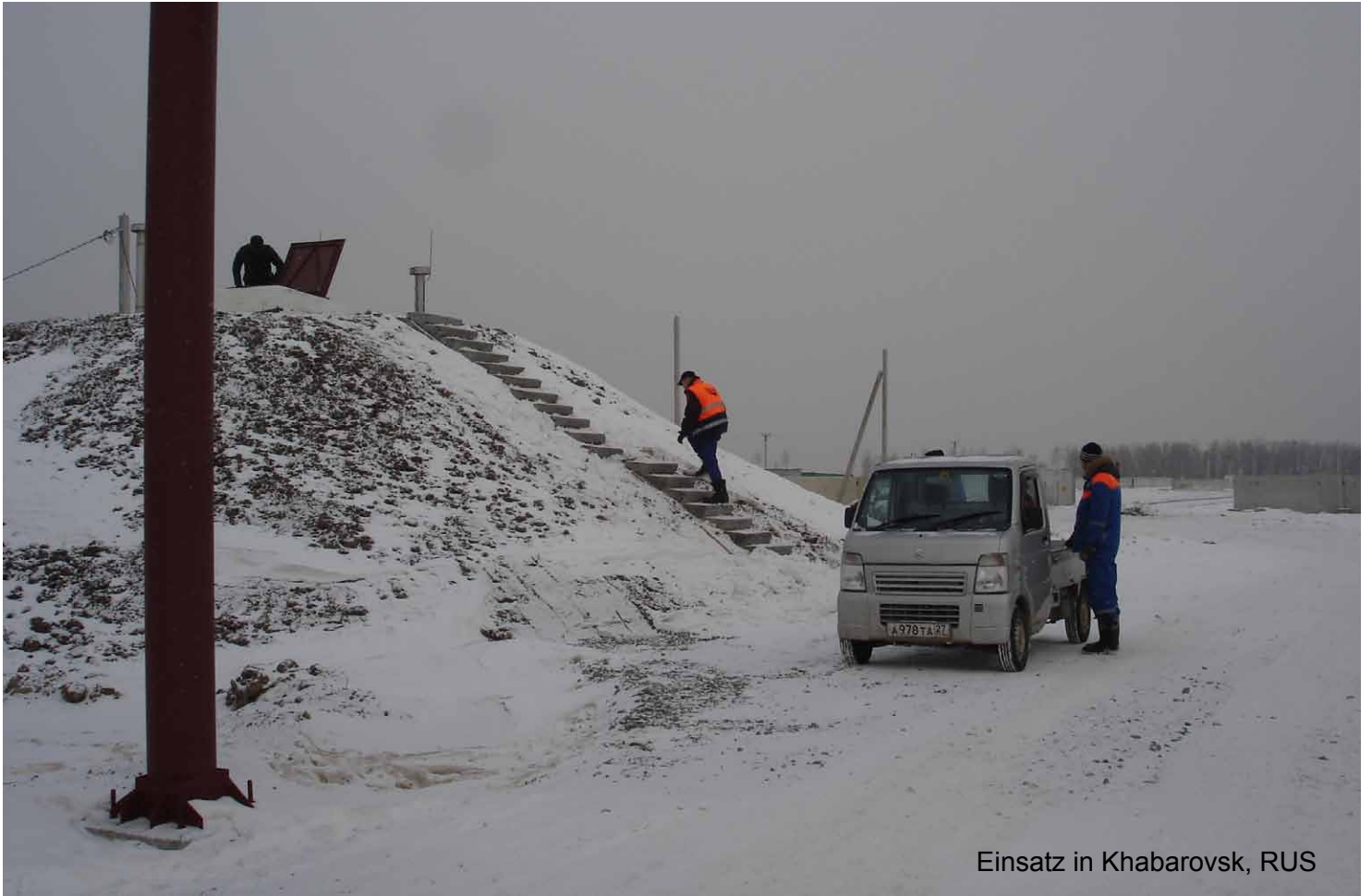
Einsatz in Khabarovsk, RUS