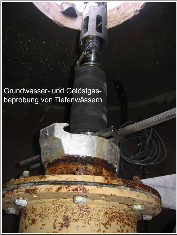
Grundwasser- und Gelöstgas- beprobung von Tiefenwässern