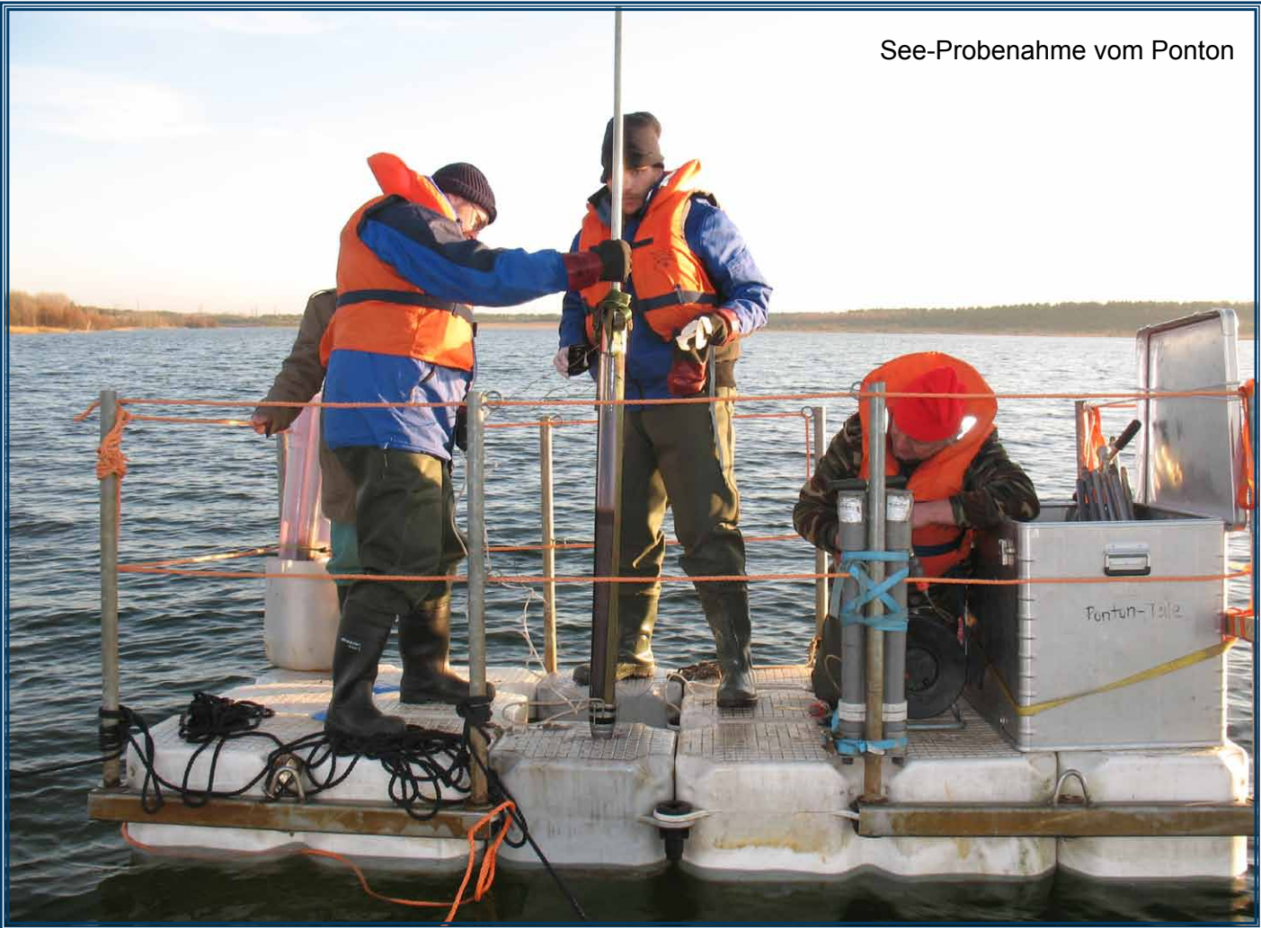
See-Probenahme vom Ponton