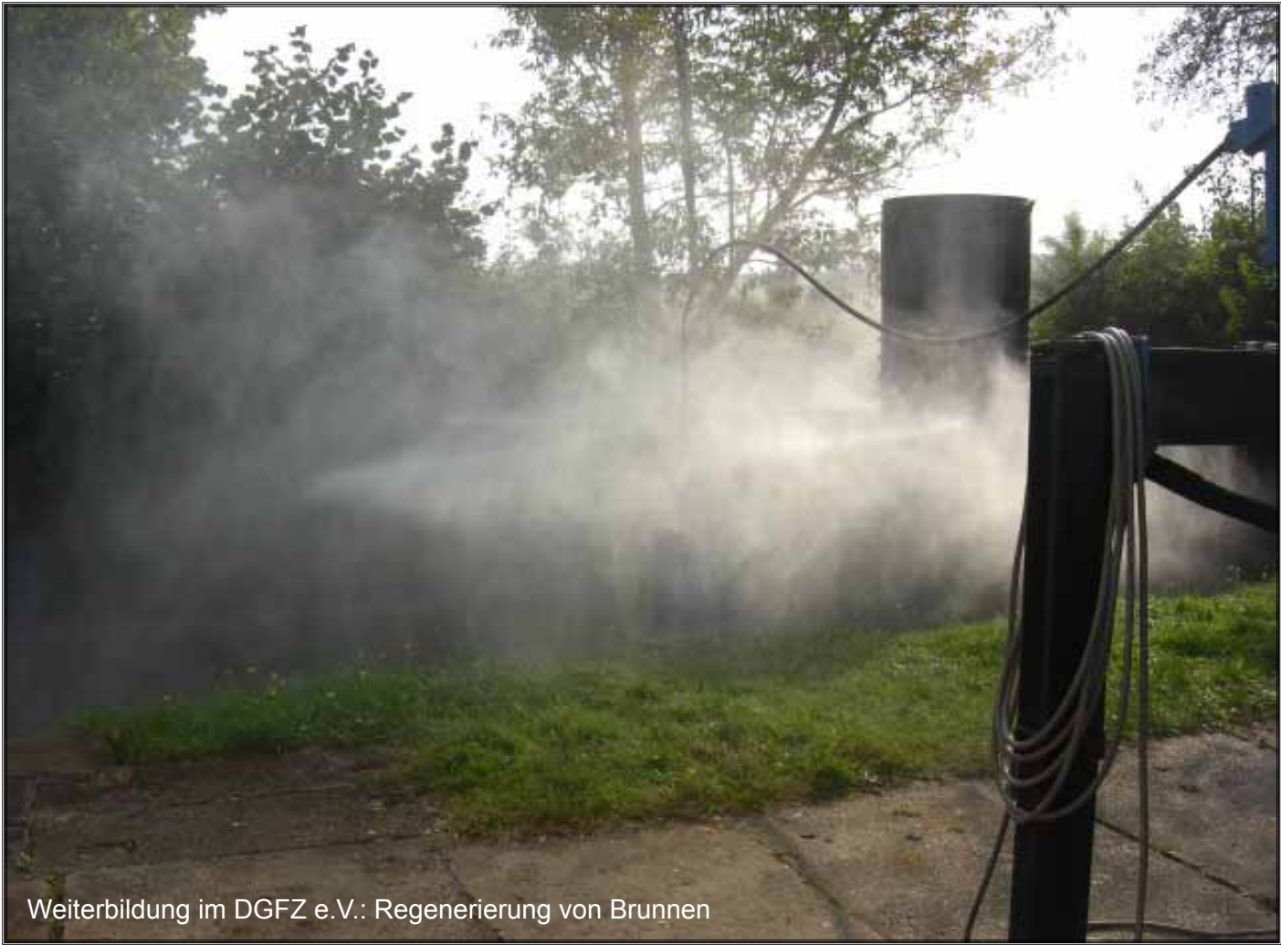
Weiterbildung im DGFZ e.V.: Regenerierung von Brunnen