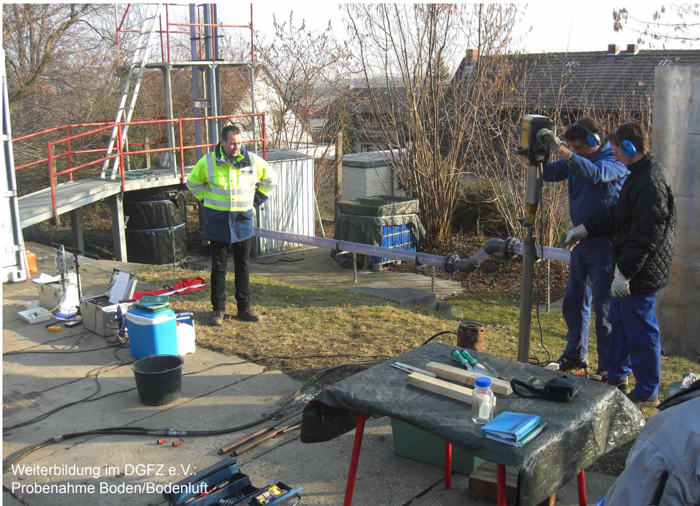
Weiterbildung im DGFZ e.V.: Probenahme Boden/Bodenluft