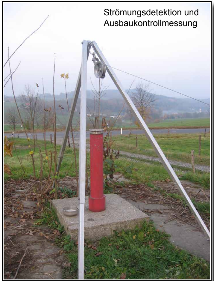
Strömungsdetektion und Ausbaukontrollmessung